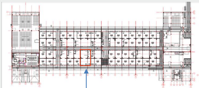
Cases 54B et 56